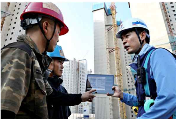
▲ GS건설 아파트 현장에서 '자이 보이스'를 활용해 외국인 근로자에게 작업 유의사항을 설명하고 있는 사진

현대건설, AI 기술 접목 'H 시리즈' 힐스테이트 봉담 적용 대우건설, AI 기반 계약문서 분석시스템 '바로답 AI' 선봬 GS건설, 생성형 AI 기반 번역 프로그램 '자이 보이스' 개발