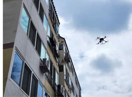
한국건설기술연구원 건축연구본부 연구팀이 간주시예 위치한 5층 규모의 노후화된 아파트에서 드론을 활용해 심의 안전 점검을 시행하고 있다.

인공지능(AI) 기술과 무인기 영상데이터를 기반으로 노후화된 건축물의 손상 정도를 파악할 수 있게 됐다. 건축물 안전 확보를 위한 활용 기술이 될 것으로 기대된다.