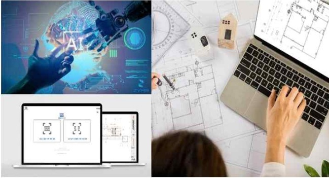
AI가 기획, 설계는 물론 시공 등 건설업 전반에서 역할을 확대하고 있다.

“[대전환시대] AI 품은 건설...안전도 효율도 '기대 이상'” - 이뉴스투데이(2024.05.10) -