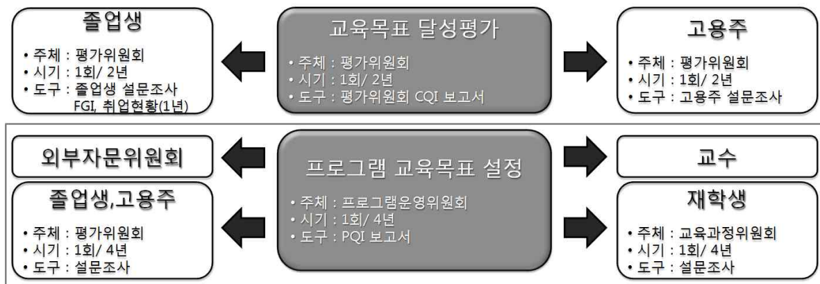
프로그램 교육목표 및 전공능력 재설정을 위한 구성원들의 연관도