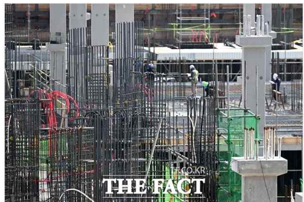
전 세계 건설 AI 시장 규모가 커지고 있는 가운데 국내 건설사들도 AI 기술을 건설현장에 적용 확대하고 있다. 사진

세계 건설 AI 시장 규모 지난해 2조원 돌파 지속 성장 전망 DL이앤씨-포스코이앤씨-현대건설 등 건설현장 AI 기술 적용